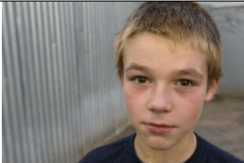
RÄÄGIVAD NOORED ISE

„Ta on hakanud mulle rohkem rääkima. Enne oli endassesulgunud, midagi ei rääkinud. Võib olla terapeut õpetas usaldama? Sest nii palju kordi terapeut ütles, et sa pead ema juurde tulema, rääkima, ta alati kuulab sind, hellitab, annab nõu. Ja praegu... isegi kui koolis midagi juhtub, ikka tuleb ja räägib.“