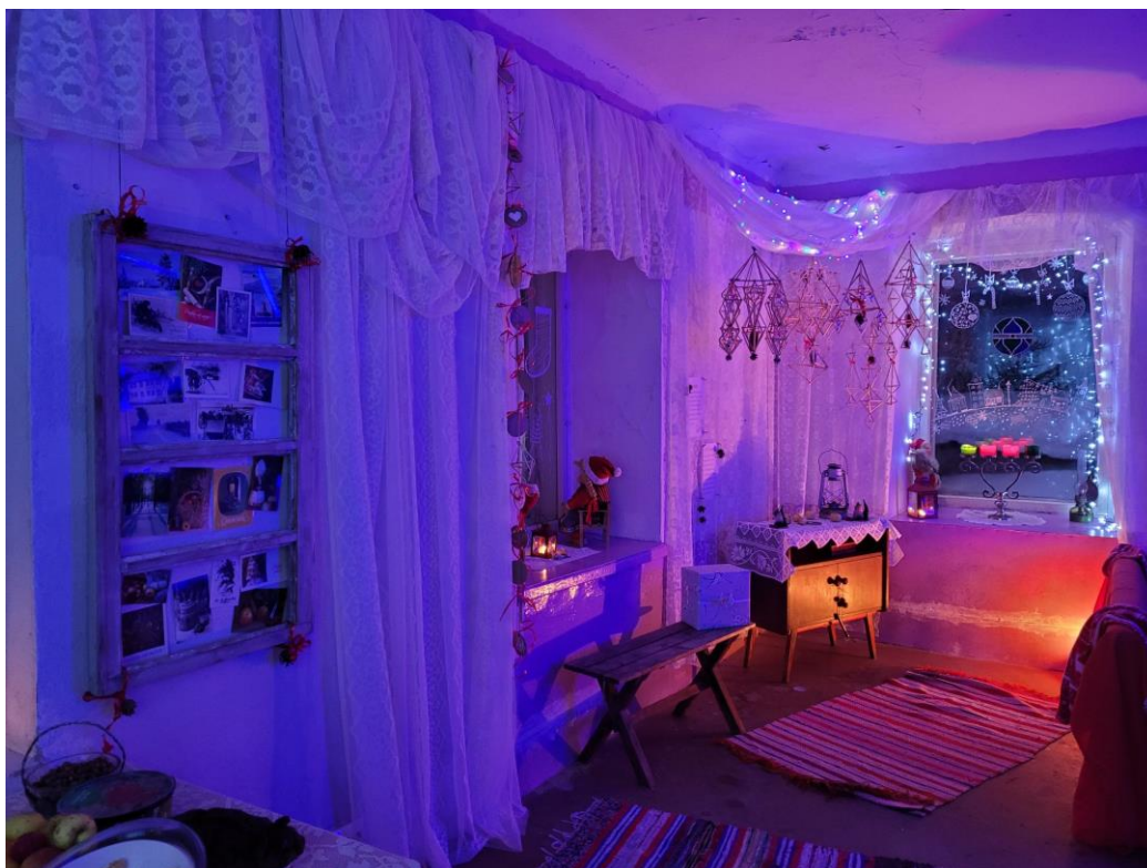
Pilt 2: Vana aja jõulukaunistused ja postkaardid Melsase jõulumaal, need koguti üleskutse kaudu kokku kohalikest kodudest

Melsase kogukonnamaja Saaremaal on samuti hea näide, kuidas üks kogukonnapood võib laieneda inimesi ühendavaks ja ka keskkonnahoiu ideid kandvaks ettevõtmiseks. Just kogukonnapoodi pidavad kohalikud korraldasid möödunud jõuludel esmakordselt kolmepäevase jõulumaal. Ürituse teemaks olid vana aja kombed, mistõttu olid ehted ja sisustus temaatilise meeleolu loomiseks taaskasutatud, need koguti kokku ümberkaudse piirkonna kodudest. Jõulumaal sai kuulda vana aja kommetest, aga ka kogukonnamaja ja -poe avamise loost, kohaliku kogukonna, sealhulgas eakate tegemistest. Seal korraldati töötubasid, lastele erinevaid lõbustusi, mis olid suuresti taaskasutatud materjalidest või kodustest vahenditest meisterdatud – roniti heinapallide peal, üles oli pandud põhutelk, vanad plekkpurgid olid päkapikkudeks joonistatud –, ning pakuti isevalmistatud küpsetisi ja muud kohalikku kraami. Ehkki plaan üritusel jäätmeid liigiti koguda ei õnnestunud, koguti siiski pakendijäätmed eraldi ja viidi vastavasse prügikonteinerisse.